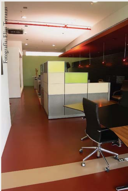
Sala de exhibición Biblmodel, Monterrey.

En ella, resulta muy sencillo comprobar que belleza, durabilidad y limpieza pueden ir de la mano y que un piso puede hacer más por el lucimiento de un espacio de lo que muchos pensarían. [●]